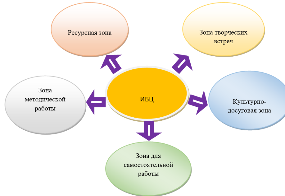
Зоны информационно-библиотечного центра

Фонд библиотеки составляет 23122 экземпляров. Все сведения о библиотечном фонде введены в «Электронный каталог 1С». База данных «Учебники» ведется на платформе MARKSQL.